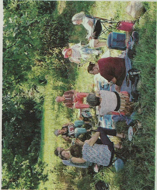
Le groupe d'habitants réuni. Une visualisation de ce que pourrait être leur futur immeuble.

Depuis l'an dernier, ils sont intéressés par le principe d'habitat participatif qui pourrait voir le jour au sein du futur quartier d'habitation de la ZAC Ferney-Genève, à Paimboeuf. C'est le collectif «CAHP» (Collectif d'Animation de l'Habitat Participatif) qui a été mandaté pour faire émerger ce projet. En novembre 2019, une réunion pu-